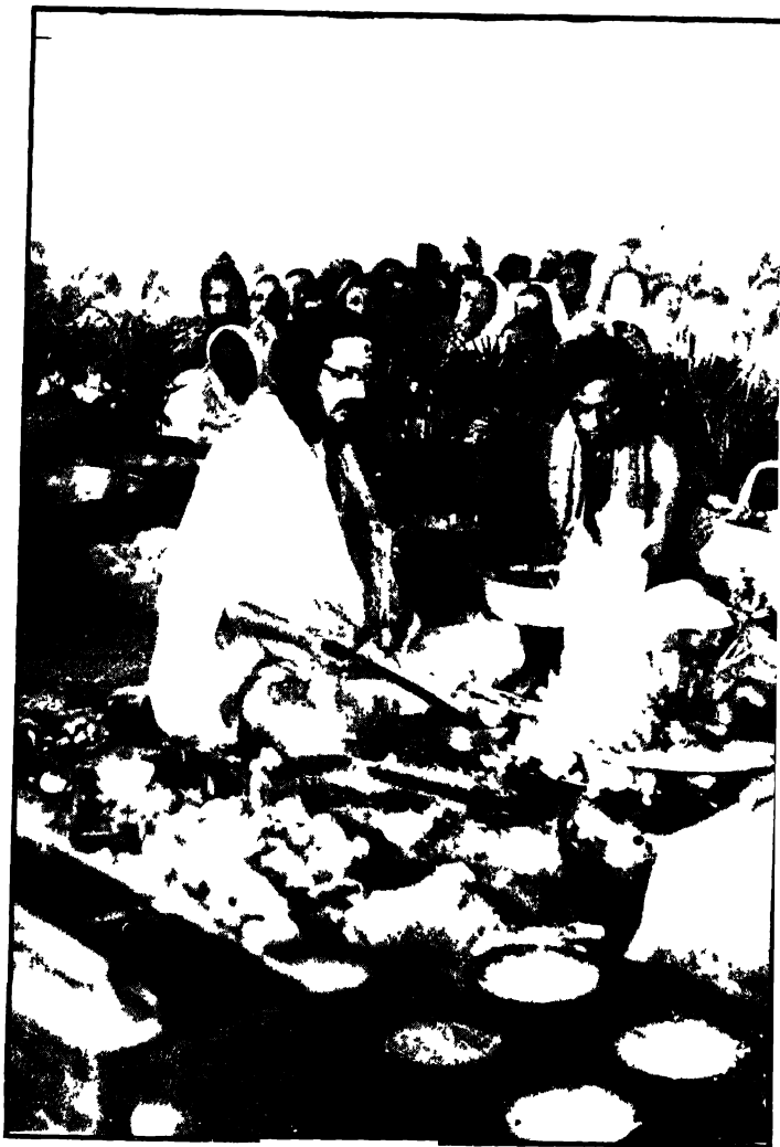
শ্রীশ্রীদত্নাবায়ণ পূজাবত শ্রীশ্রীমহাবাজ ।